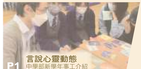
P1 言說心靈動態 中學部新學年事工介紹