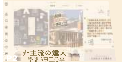
P2 非主流的達人 中學部IG事工分享