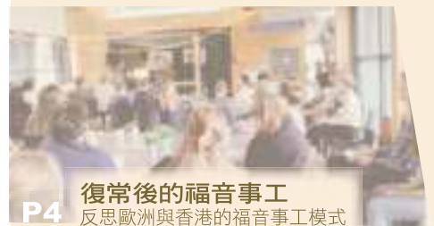
P4 復常後的福音事工 反思歐洲與香港的福音事工模式