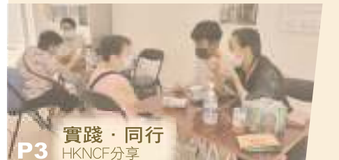
P3 實踐·同行 HKNCIF分享