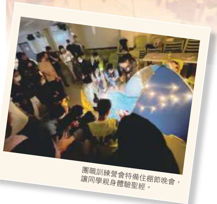
團職訓練營會特備住棚節晚會，讓同學親身體驗聖經。