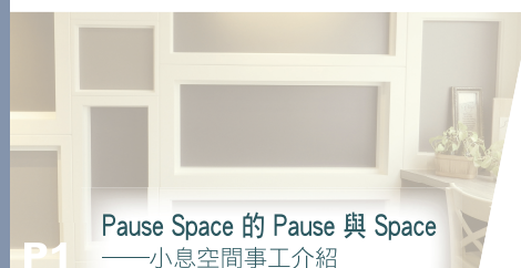
P1 Pause Space 的 Pause 與 Space ——小息空間事工介紹