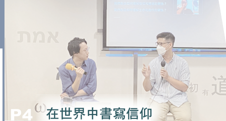
P4 在世界中書寫信仰