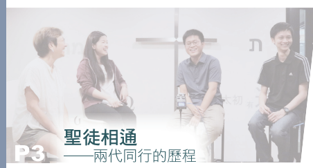
P3 聖徒相通 ——兩代同行的歷程