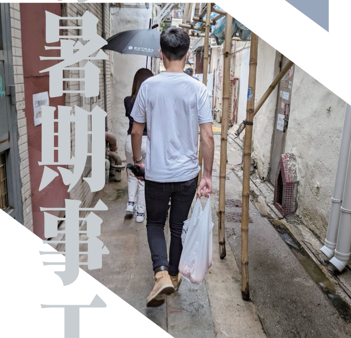
導向日：走進社區派水果